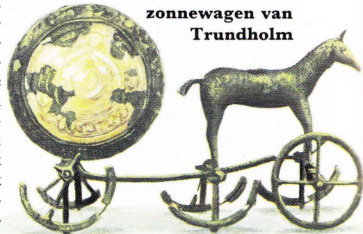
zonnewagen van Trundholm

eerst in Denemarken een afbeelding van de Christusfiguur. De inscriptie op de steen luidt: "Harald, de koning, gaf opdracht de runen te beitelen ter herinnering aan zijn vader Gorm en zijn moeder Thyra. Dezelfde Harald, die Denemarken en Noorwegen voor zichzelf won en de Denen tot het christendom bekeerde."