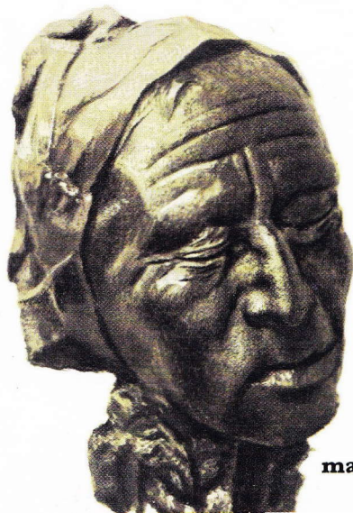
man van Tollund

Op het ogenblik dat onze gewesten met de komst van de Romeinen de eigenlijke geschiedenis ingaan, duurt de prehistorie, d.w.z. de periode waarover geen geschreven bronnen bestaan, in Denemarken nog voort. Na het bronzen tijdperk kent het land nog een Keltische, een Romeinse en een Germaanse ijzertijd. Deze laatste eindigt omstreeks 800 na C. Dan komen de vikings (800-1000), terwijl bij ons het leenstelsel een aanvang neemt. Hun komst wordt doorgaans beschouwd als het eindpunt van de Deense voorgeschiedenis en het begin van de historische tijden. Die periode kennen wij vooral uit de vele sagen en legenden, die toen een hoge bloei beleefden. De Duitse kroniekschrijver Adam van Bremen (11e